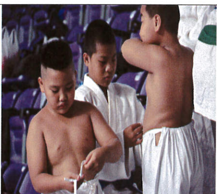
說明：學長學弟互相幫忙