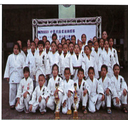
說明：男女團體賽雙料金牌