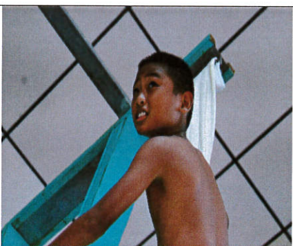
說明：爬繩肌力訓練