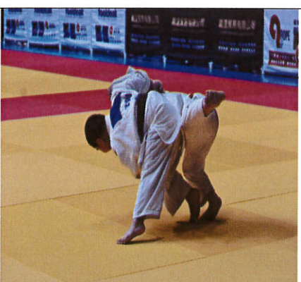
說明：抓住機會 i p p o n