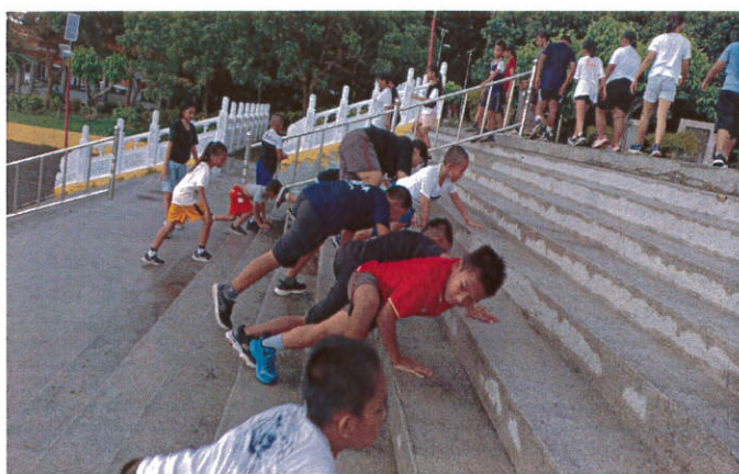
照片說明：週間體能訓練