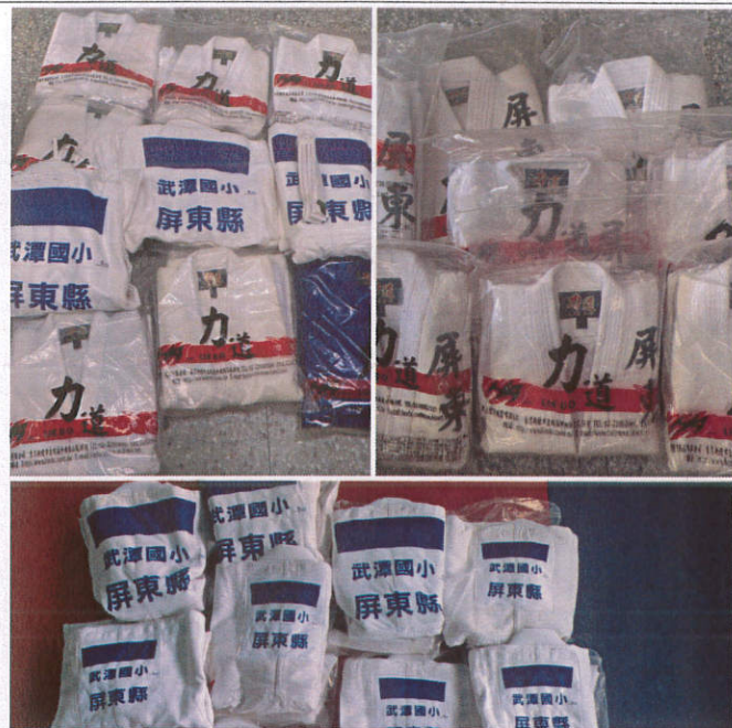
照片說明：購買柔道服