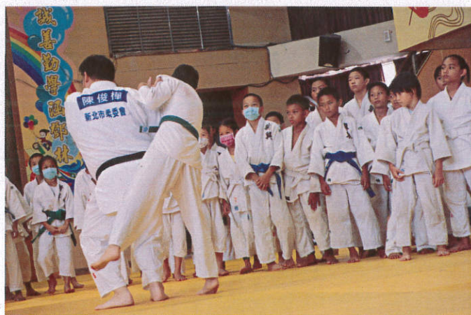
照片說明：立技教學