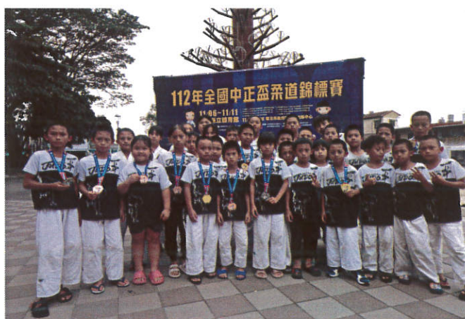
照片說明：仍舊是金光閃閃