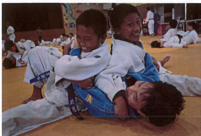
照片說明：柔道趣味教學