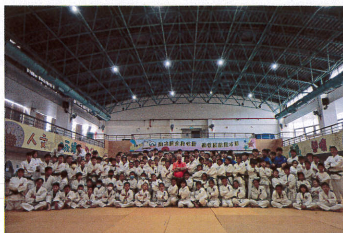
照片說明：新興、鄧光、武潭三校大合照