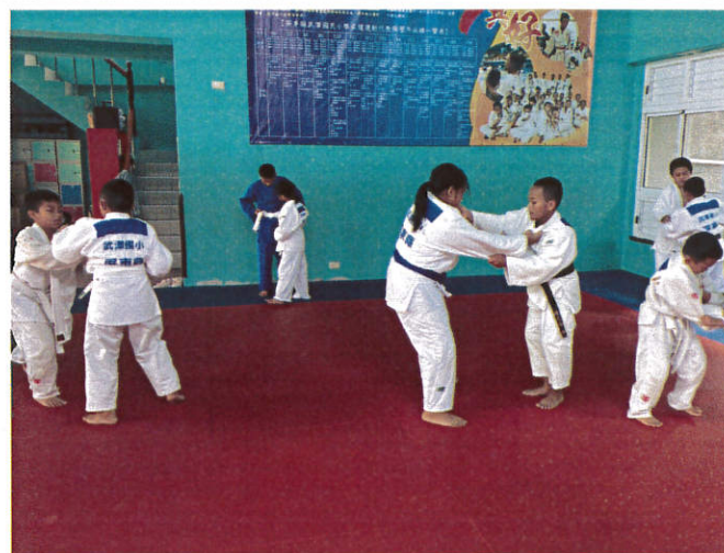
照片說明：週間專長訓練