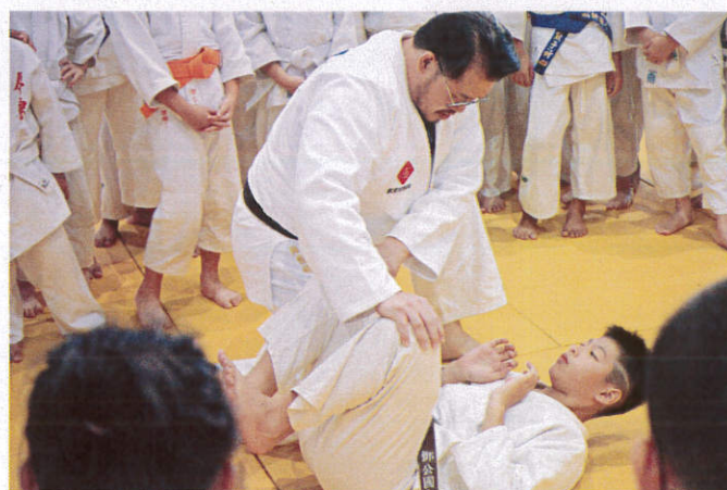
照片說明：壓制教學