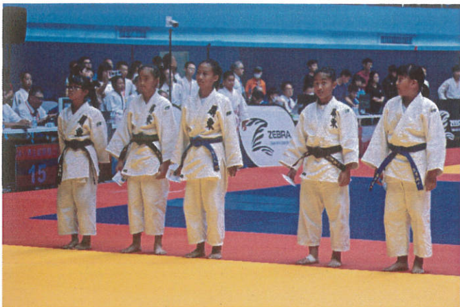
照片說明：2023年全國柔道錦標賽團體賽