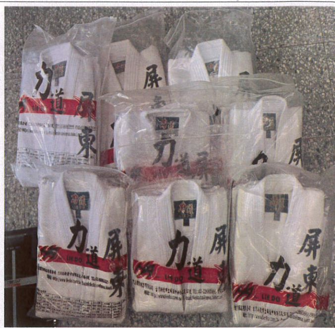
照片說明：購買訓練爬繩布