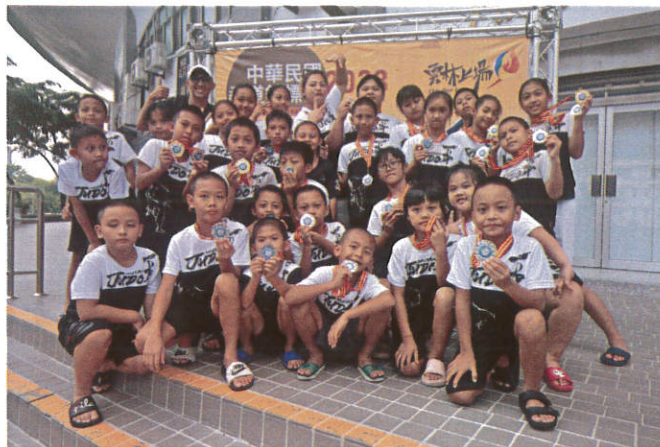
照片說明：榮獲全國最佳成績